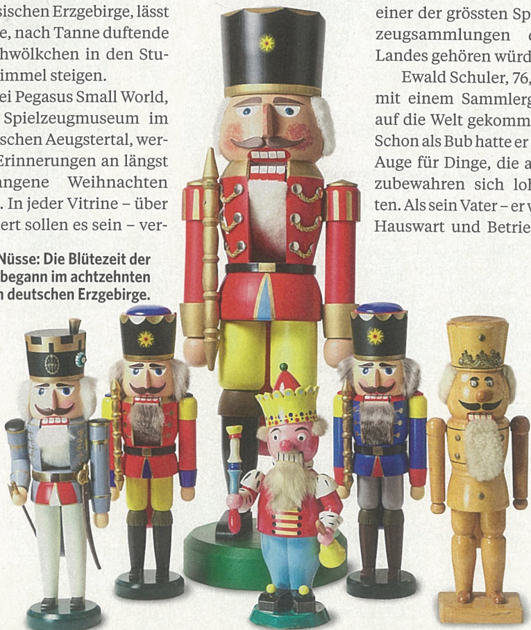
Eins auf die Nüsse: Die Blütezeit der Nussknacker begann im achtzehnten Jahrhundert im deutschen Erzgebirge.