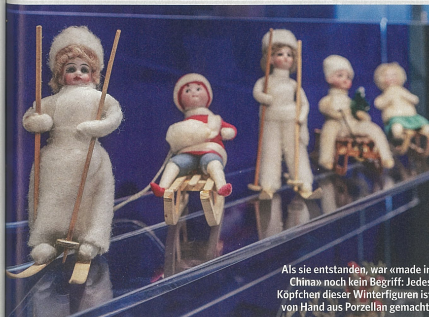
Als sie entstanden, war «made in China» noch kein Begriff: Jedes Köpfchen dieser Winterfiguren ist von Hand aus Porzellan gemacht.