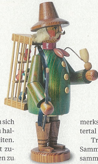
Obwohl das Drechselhandwerk auch in der Schweiz verbreitet ist - Räucher-männchen haben hier keine Tradition.