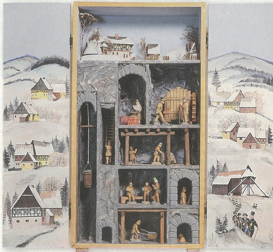
Tragbarer Headhunter: Mit diesem Schaukasten aus dem Erzgebirge wurde im ganzen Land um Arbeiter geworben.