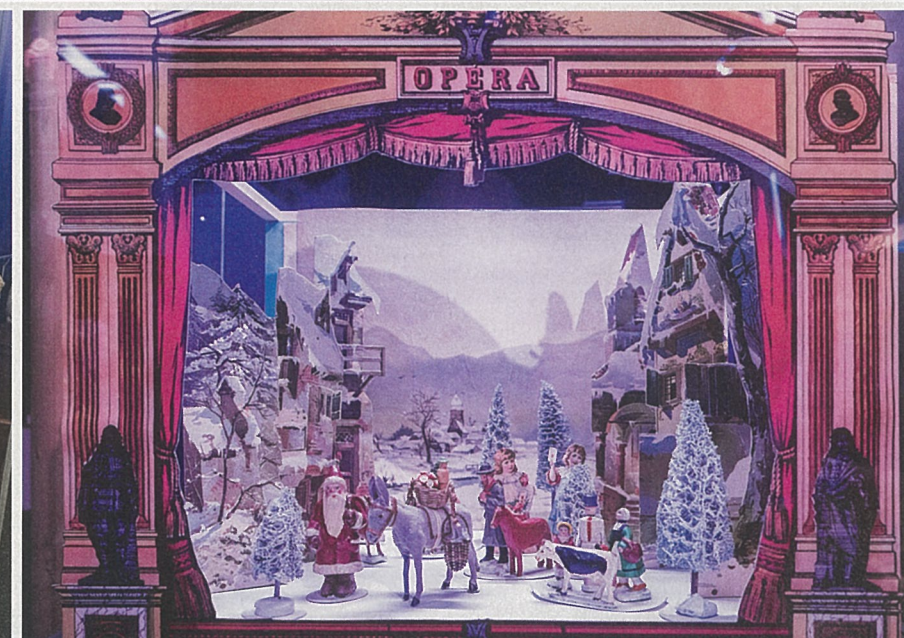
Die ganze Welt ist eine Bühne: Papiertheater waren im neunzehnten Jahrhundert ein beliebtes Spielzeug - auch in der Schweiz. Produziert aber wurden sie hier nie. Deutschland und Frankreich zählten zu den wichtigsten Herstellungs- und Exportländern.