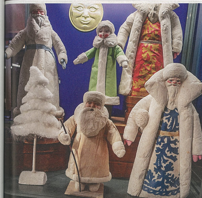
Schickes Outfit: Väterchen Frost, die Personifizierung des Winters, bringt osteuropäischen Kindern in der Neujahrsnacht die Geschenke. Dabei wird er von seiner Enkelin Snegurotschka, Schneeflöckchen, begleitet.