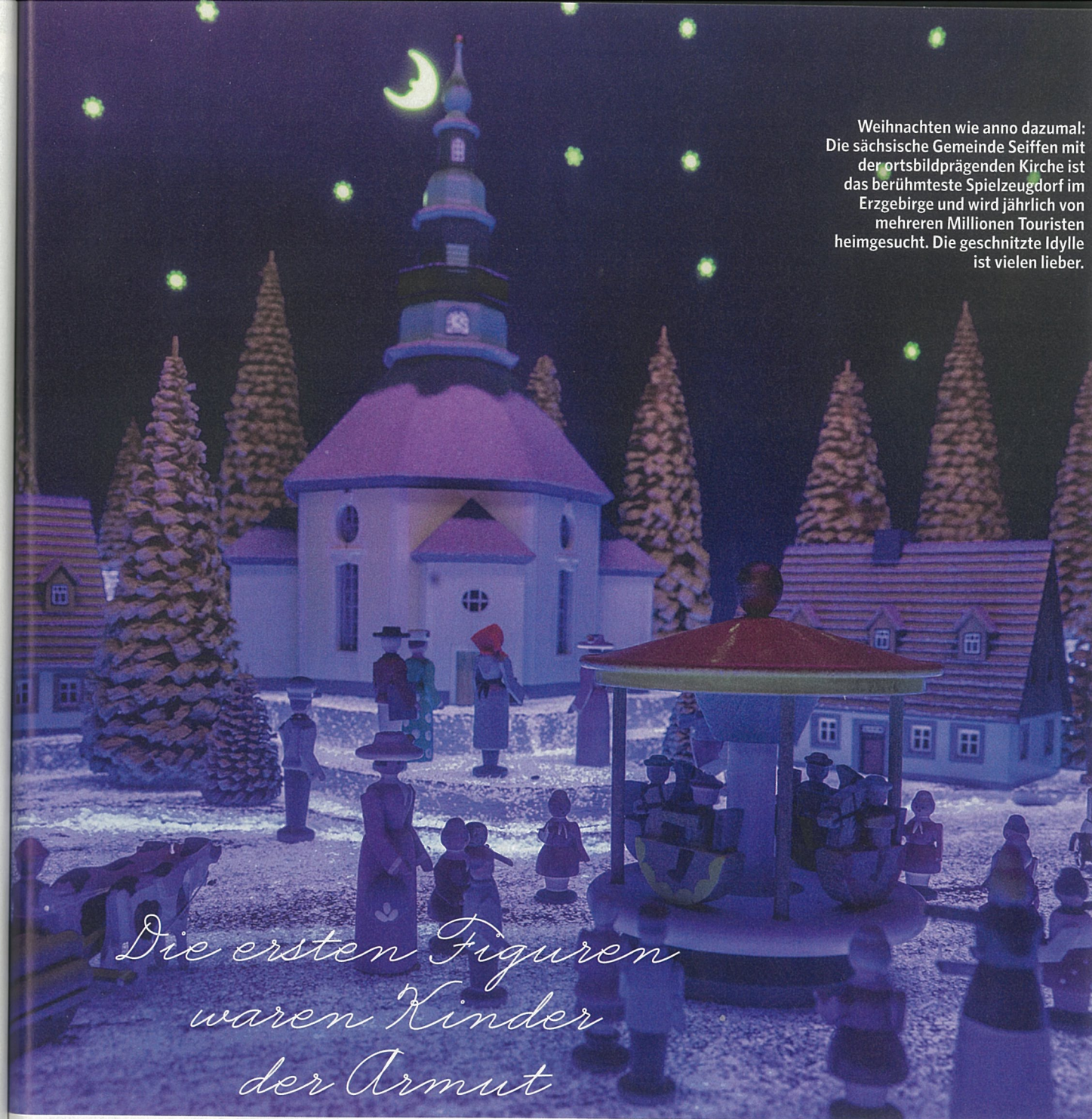
Weihnachten wie anno dazumal: Die sächsische Gemeinde Seiffen mit der ortsbildprägenden Kirche ist das berühmteste Spielzeugdorf im Erzgebirge und wird jährlich von mehreren Millionen Touristen heimgesucht. Die geschnitzte Idylle ist vielen lieber.

Franz Carl Weber an der Bahnhofstrasse ist Geschichte. Wie die aufwendig gestalteten Weihnachtsschaufenster der grossen Warenhäuser, an denen sich kleine und grosse Kinder einst die Nase platt drückten, fahrende Eisenbahnen und bewegliche Figuren bestaunten. Genau dort, wo die Sehnsucht nach der Weihnachtsidylle am grössten ist, zmittst in der Stadt, hätte sich Ewald Schuler sein Museum gewünscht. Doch die unverschämte hohen Immobilienpreise machten jede Hoffnung zunichte. Was nicht nur schade für ihn, sondern